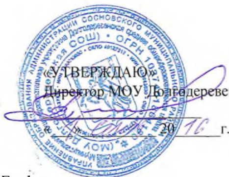
График контроля за состоянием охраны труда в МОУ Долгодеревенская СОШ на 2016–2017 учебный год