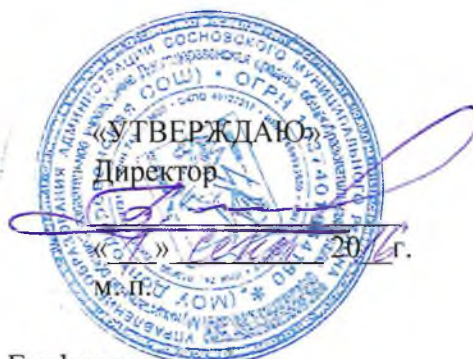
График контроля за состоянием СанПиН в МОУ Долгодеревенская СОШ на 2016 –2017 учебный год